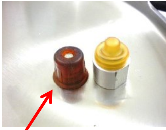
メインバルブ(圧力調節弁)